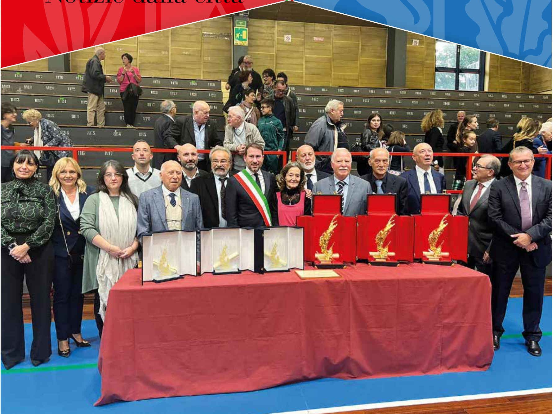
Spiga d'oro 2022