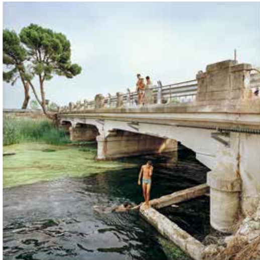
© Filippo Romano, Statale 106, 2018

Inoltre, il Museo anticipa la riapertura