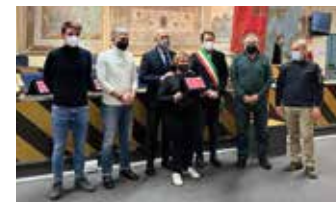
Premio presepe più bello a "Pollo Mio" di via S. Paolo