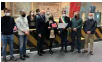
2° classificato "SG Differente" acconciature di via Dante

di 110 esercizi commerciali e 14.314 voti espressi da parte dei cittadini. Il primo posto è stato attribuito al Bar al Portico "Motta" di via San Paolo, il secondo posto a "SG Differente" acconciature di via Dante, il terzo posto a "La bottega delle Cialde" di via Monte Grappa. I titolari delle 3 vetrine