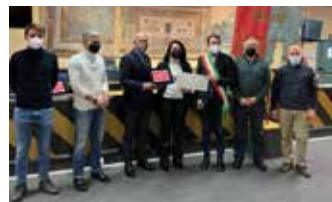
3° classificato "La bottega delle Cialde" di via Monte Grappa

vincitrici hanno ricevuto rispettivamente, oltre alle targhe ricordo del concorso, un premio in denaro pari ad € 500,00; € 300,00 ed € 150,00. Inoltre il Bar al Portico "Motta" potrà esporre il prestigioso trofeo, ad opera del maestro Silvano Vismara, "Miglior Vetrina Natalizia" che di anno in