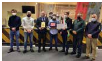
1° classificato Bar al Portico "Motta" di via San Paolo

Si è conclusa, con la cerimonia di premiazione che si è tenuta in Aula consiliare il 15 febbraio, la terza edizione del concorso Natale in vetrina, dedicato a tutti i negozi di vicinato che hanno una vetrina sulla pubblica via. Nato nel 2019 il concorso ha lo scopo di creare, durante le festività natalizie, nella nostra città un'atmosfera gioiosa ed elegante e di dare visibilità ai tanti commercianti che ogni giorno esercitano la loro attività a Cinisello Balsamo. Anche quest'anno grande soddisfazione per la riuscita dell'evento che ha visto la partecipazione