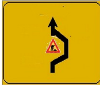
PREAVVISO DI DEVIAZIONE