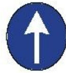
DIREZIONE OBBLIGATORIA DIRITTO