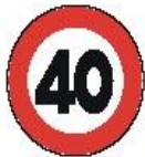
LIMITE DI VELOCITA'