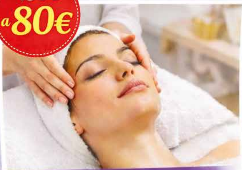
Pulizia Viso + Head Spa