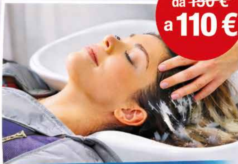
Pressoterapia + Head Spa