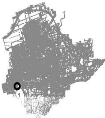
individuazione lotto su territorio comunale

A) DESCRIZIONE IMMOBILE: Terreno di circa mq. 350, situato a sud del territorio cittadino, tra la via Modigliani ed il tratto urbano di autostrada TO-VE, censito al Catasto Terreni del Comune di Cinisello Balsamo al Fg. 42, Mapp. 130, con destinazione "Attrezzature pubbliche e di interesse pubblico e generale riconfermate". La maggior parte dell'area è soggetta inoltre al vincolo di inedificabilità poiché inserita all'interno della fascia di rispetto autostradale. L'area gode di un'ottima accessibilità da via Modigliani ed è situata in una zona ben servita dalla rete viaria cittadina. (V. planimetria sottostante)