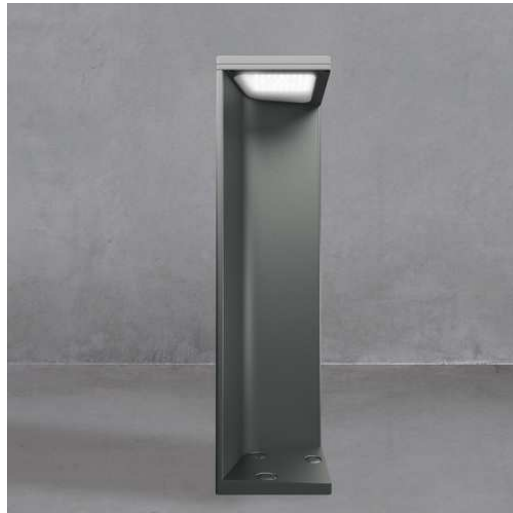
illuminazione bassa per accessi al palazzo