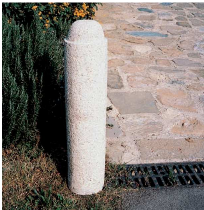
paracarro in granito a delimitazione del piazzale del palazzo e della piazzetta pedonale