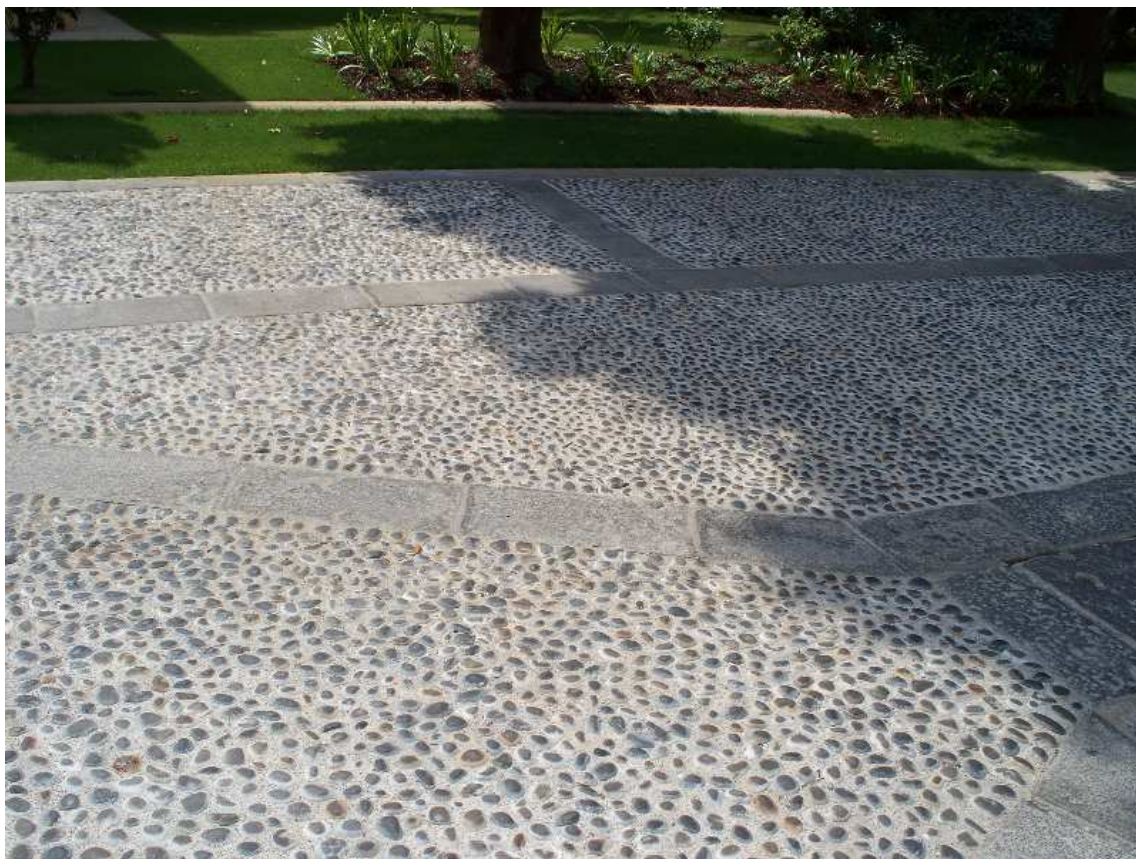
Pavimento in ciottoli