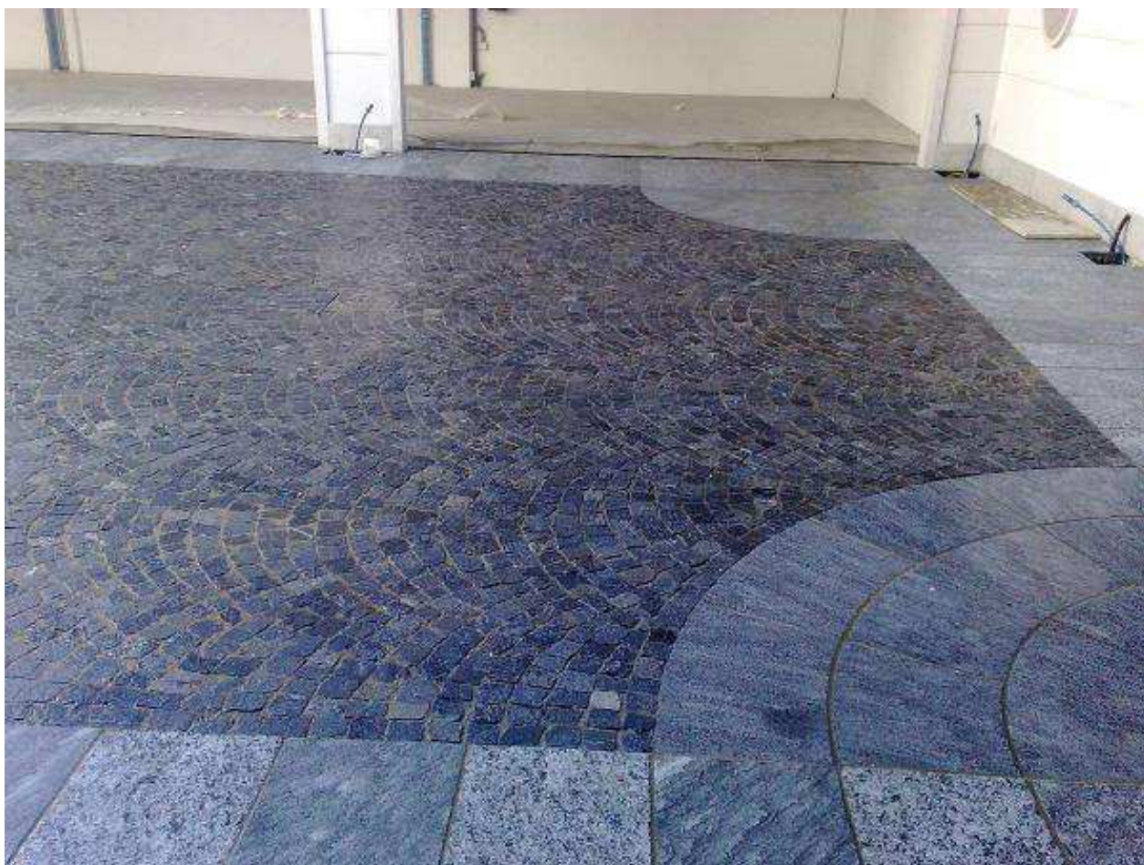
pavimentazione in binderi di beola

Sul lato nord sono collocate due panche in granito eseguite su disegno, la pavimentazione è in lastre di serizzo "a correre" nella parte centrale, in cubetti di beola nella parte esterna. Il Piazzale è delimitato verso la strada da dissuasori in granito della stessa tipologia di quelli posti a delimitazione del piazzale del palazzo ad eccezione di un dissuasore mobile per consentire l'accesso ai residenti negli edifici che prospettano sulla piazzetta e ai mezzi di servizio alla scuola Materna Codazzi.