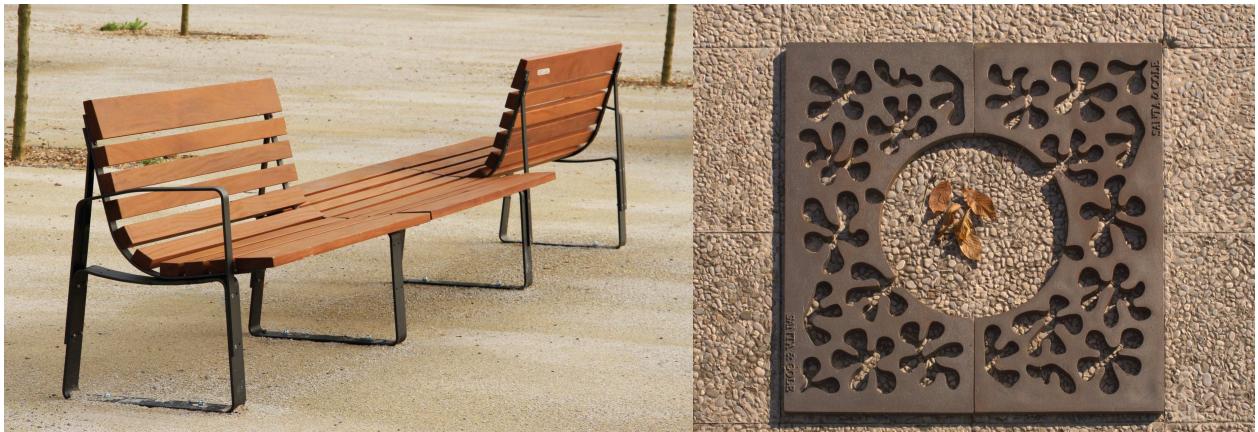
Panchine per zona ovale nel centro dei giardini . Griglie per tornelli degli alberi