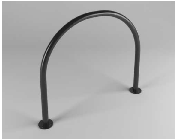
Cestino e portabici ad arco, entrambi verniciati in grigio scuro