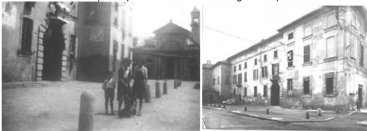
Palazzo Omodei – foto d'epoca

Il piazzale d'ingresso al palazzo ha la pavimentazione in serizzo, per le zone transitabili dai pedoni. Le zone non soggette al transito dei pedoni sono in acciottolato. L'accesso al piazzale è limitato da dissuasori in granito, che ricalcano nella forma quelli preesistenti in zona. In tal modo si è ripreso quanto illustrato dalle immagini a noi pervenute.