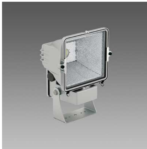
lampada da porre in basso per illuminare la croce storica