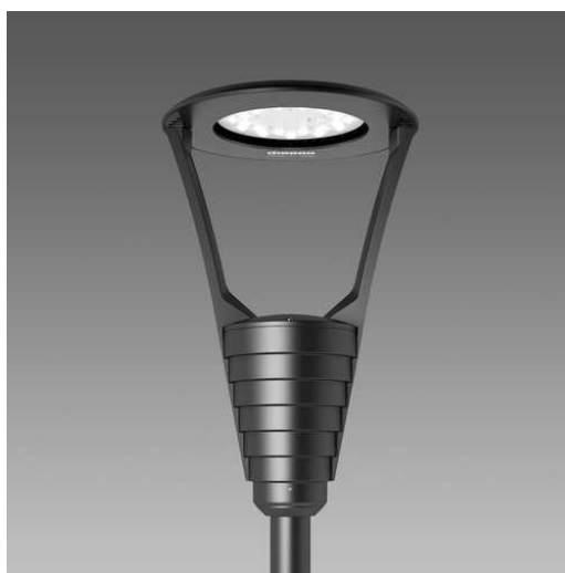
illuminazione pubblica pedonale, per illuminazione generale su palo da ml. 5,00

La strada sarà illuminata da lampioni stradali altezza 9 metri, mentre la piazzetta pedonale da lampioni pedonali altezza 5 metri, integrata da una illuminazione specifica per la croce storica.