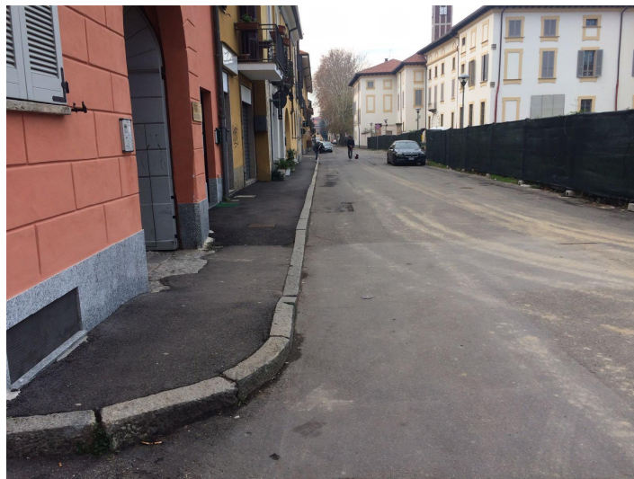
Foto n.2 tratto stradale di via Omodei