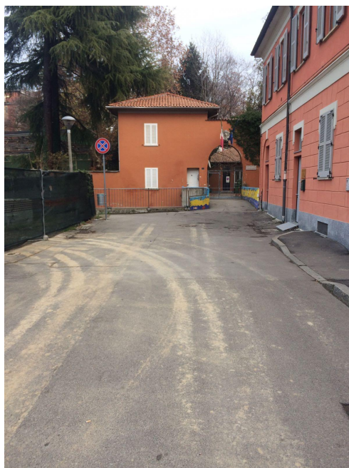
Foto n.4 area piazza pedonale