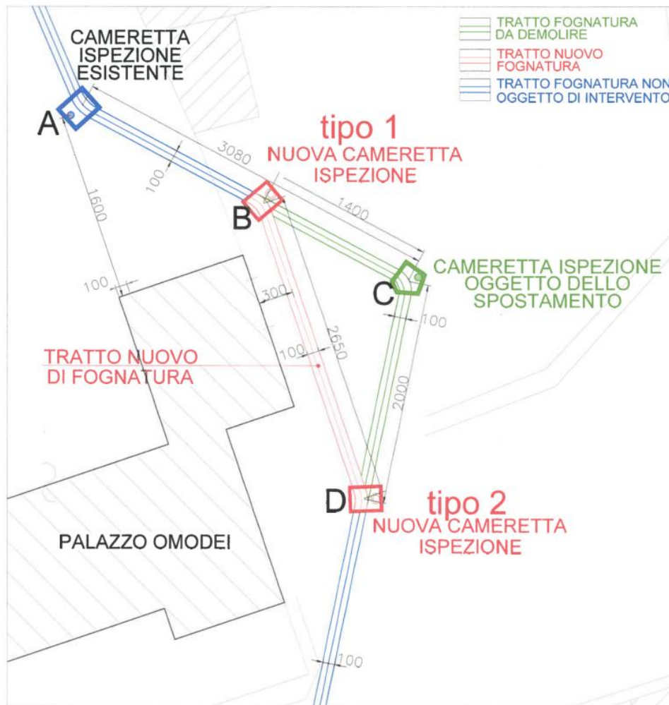
pianta chiave - fuori scala