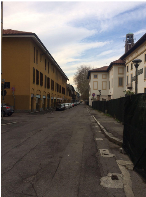
Foto n.3 tratto stradale di via Omodei