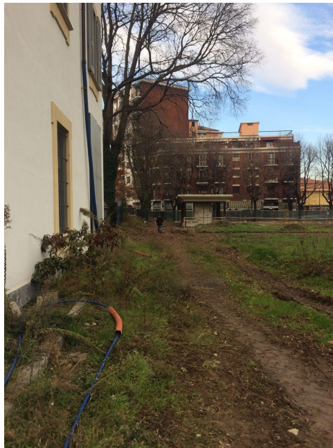
Foto n.6 area giardini

Sull'area oggetto dei lavori sono presenti diverse linee in sottoservizio per le quali si rimanda per una migliore identificazione al progetto principale. In particolare si segnala la presenza di un condotto consortile fognario in cls del diametro di 1000 mm, posizionato sul lato est del palazzo a circa 3,0 m dal filo fabbricato e altrettanti circa dal parcheggio interrato, per l'intervento si è fatto riferimento alla tavola