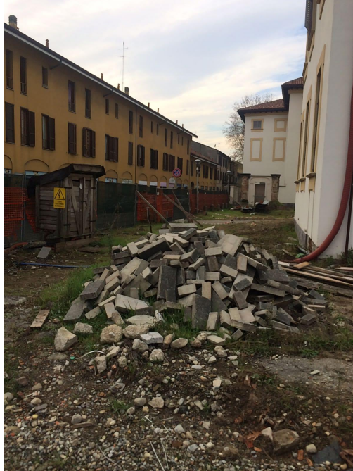
Foto n.1 area piazza palazzo