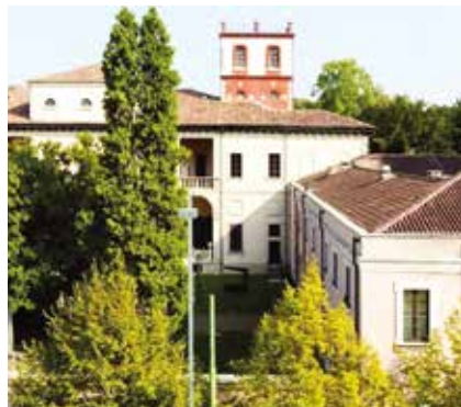
Il Museo Nazionale di Fotografia vedrà inoltre ampliarsi la sua sede sempre

Il Museo di Fotografia Contemporanea, unico museo pubblico in Italia dedicato interamente alla fotografia e all'immagine tecnologica, è diventato MUNAF - Museo Nazionale di Fotografia. Si è infatti concluso l'iter amministrativo e giuridico con la modifica e adozione del nuovo Statuto frutto di un accordo tra Ministero della Cultura, Città metropolitana di Milano. Comune di Cinisello Balsamo e direzione del Museo, con Davide Rondoni confermato Presidente della Fondazione.