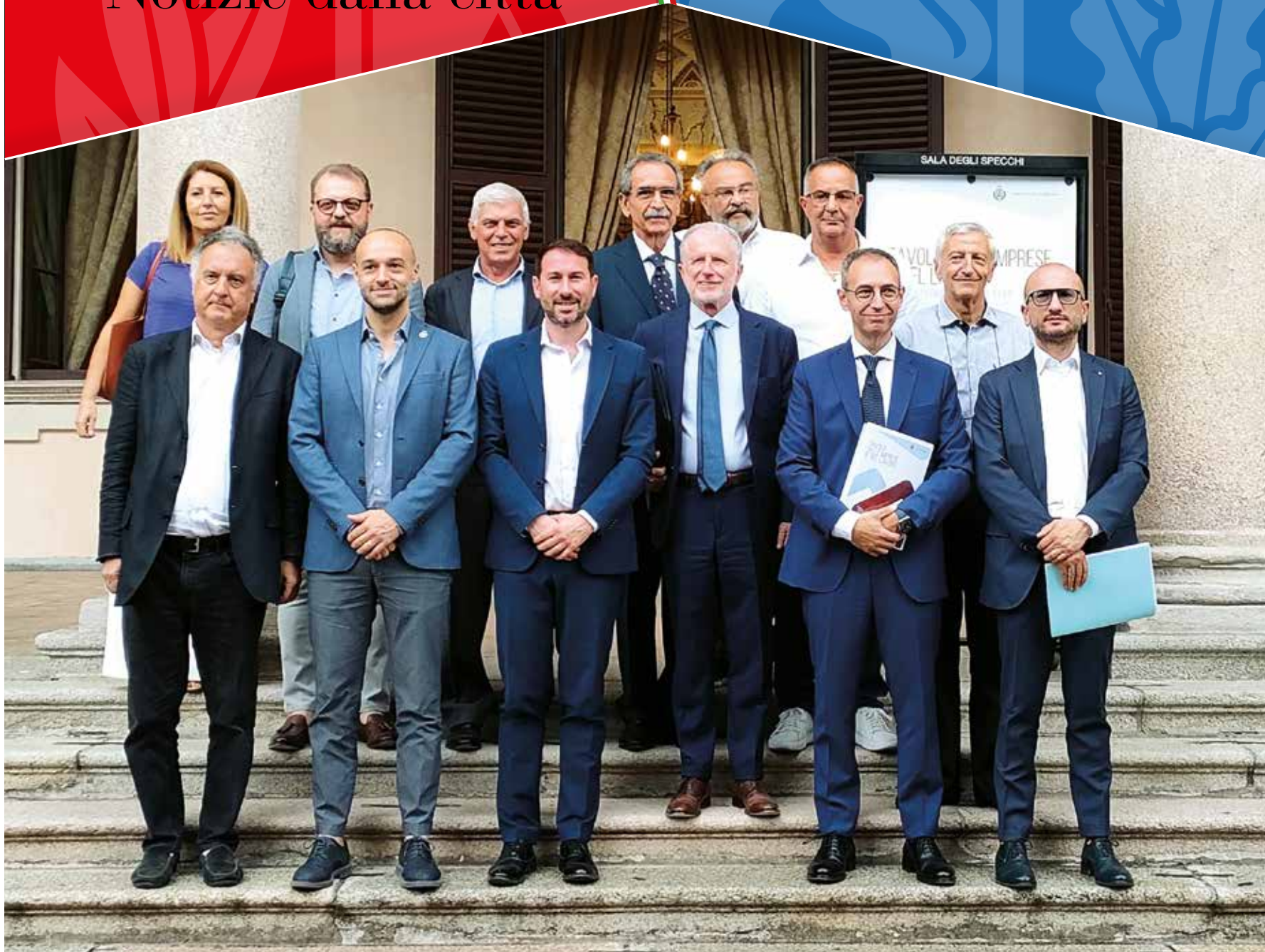
Nasce il "Tavolo delle imprese e del lavoro"