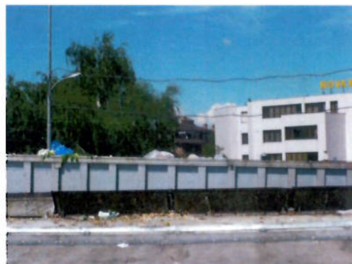
Chiusura anello lato cassone