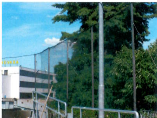
Rete di protezione e oscuramento