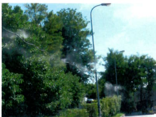
Sistema abbattimento odori