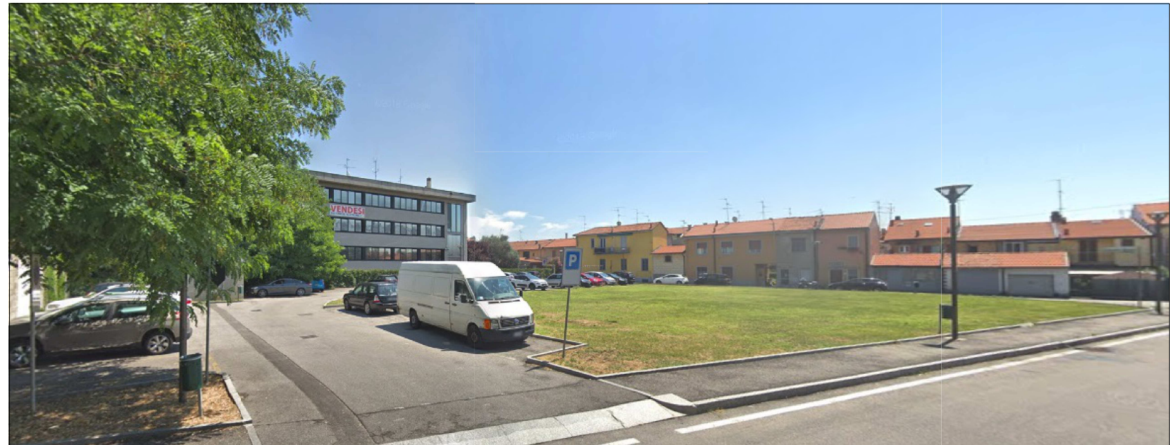
RILIEVO STATO DI FATTO - VISTA 2