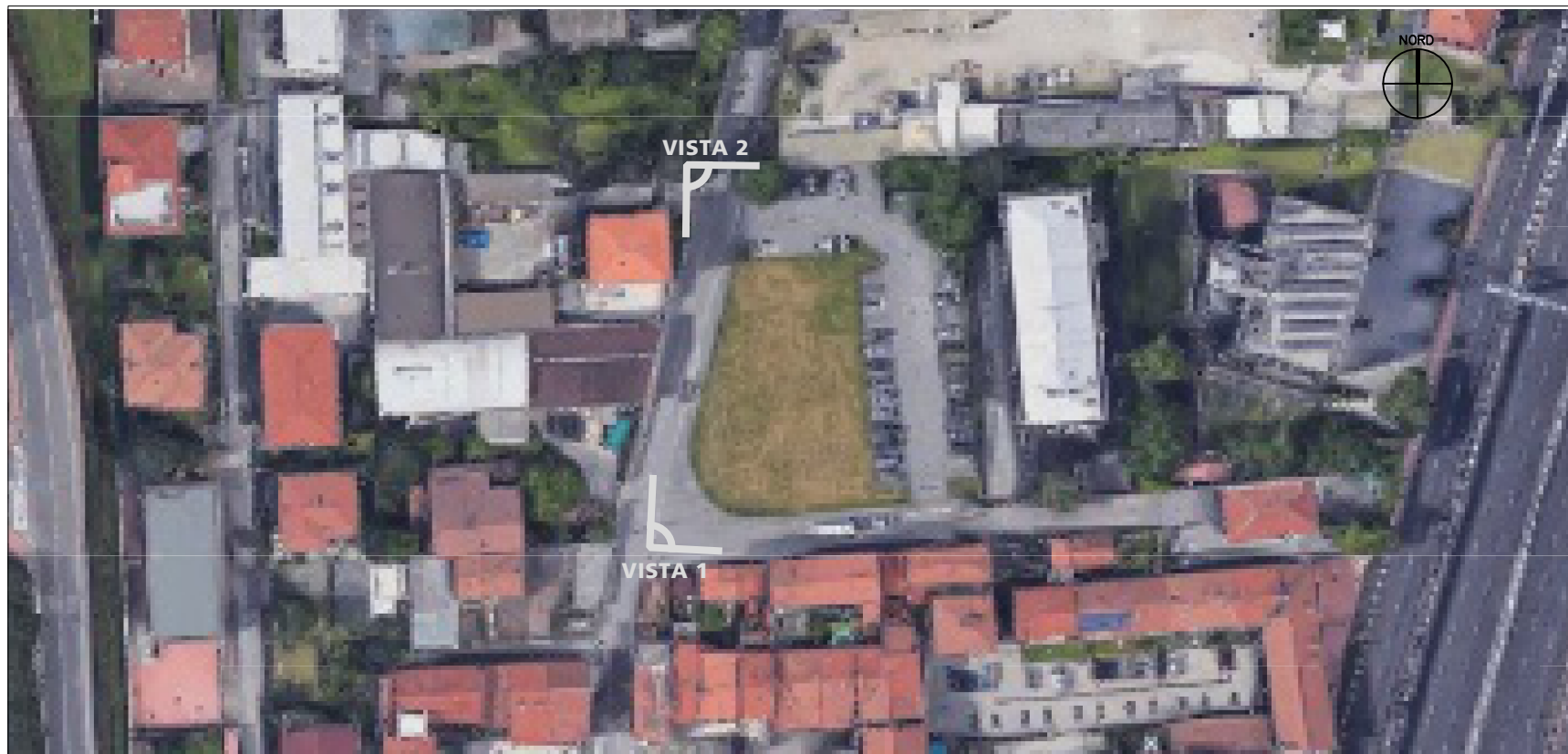
FOTO AEREA - LOCALIZZAZIONE GIOCHI