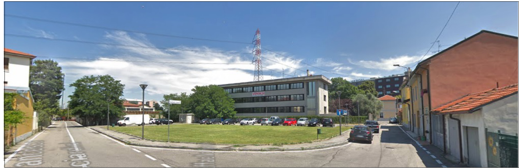
RILIEVO STATO DI FATTO - VISTA 1