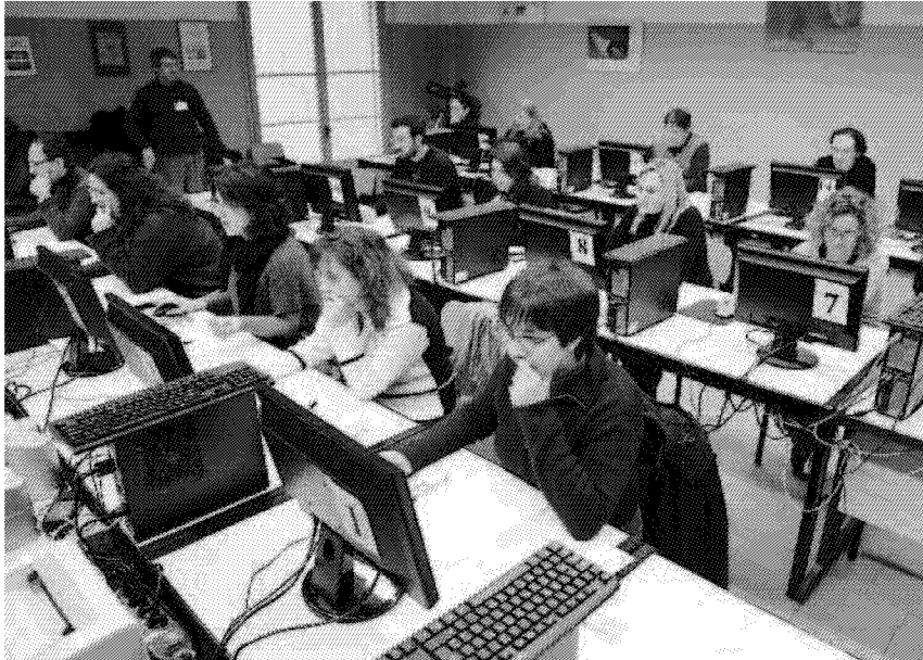
IN AULA Studenti al computer in un concorso. Sotto il ministro Carrozza