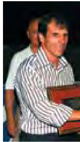
2005 - Gianfranco Zola