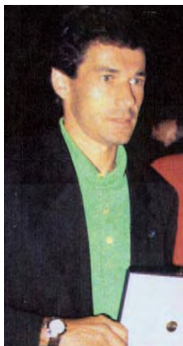
1992 - Beppe Baresi

2003 CIRO FERRARA 2004 BEPPE SIGNORI 2005 GIANFRANCO ZOLA 2006 GIANLUCA PESSOTTO 2007 FILIPPO INZAGHI 2008 ALESSANDRO DEL PIERO 2009 CRISTIANO DONI 2010 JAVIER ZANETTI 2011 ANTONIO DI NATALE 2012 GENNARO GATTUSO