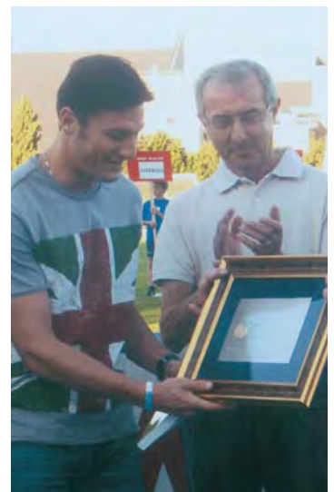
2010 - Javier Zanetti