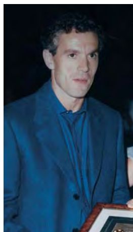
1998 - Roberto Donadoni