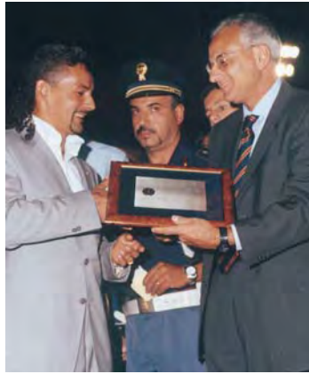
2001 - Roberto Baggio