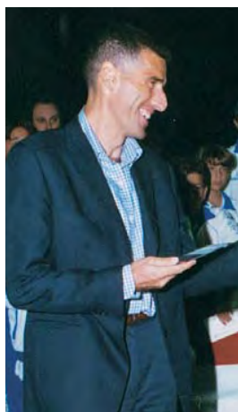
1996 - Mauro Tassotti