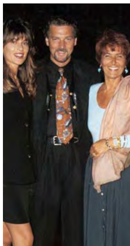
1993 - Stefano Tacconi