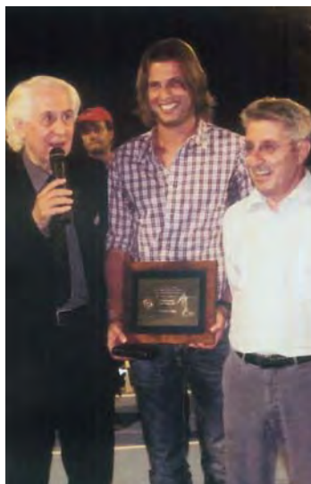
2009 - Cristiano Doni