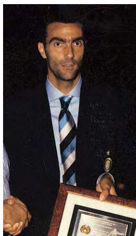
1997 - Beppe Bergomi