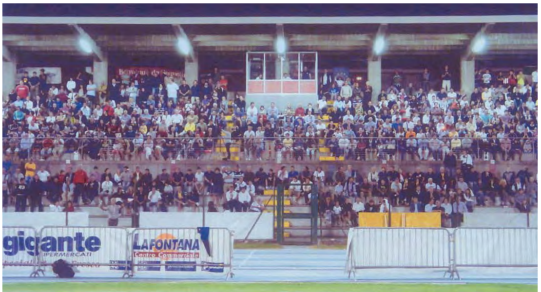
Il pubblico dello Stadio Gaetano Scirea