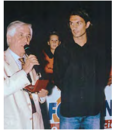
2002 - Paolo Maldini.