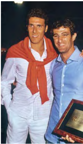
2003 - Ciro Ferrara