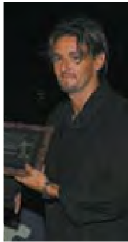
2004 - Beppe Signori