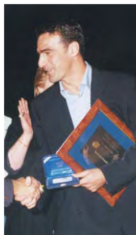
1999 - Michelangelo Rampulla