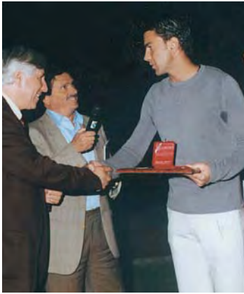
2000 - Alessandro Costacurta