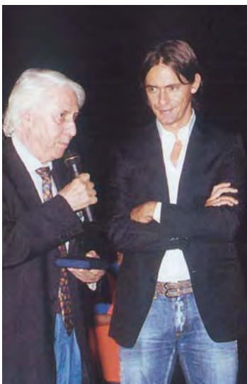
2007 - Filippo Inzaghi