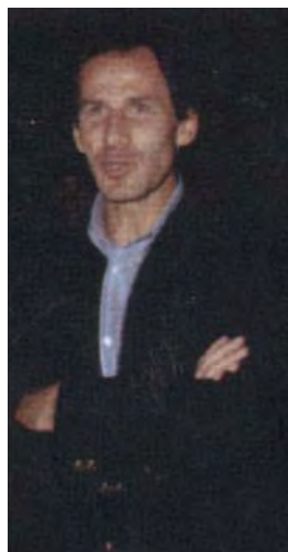
1994 - Franco Baresi