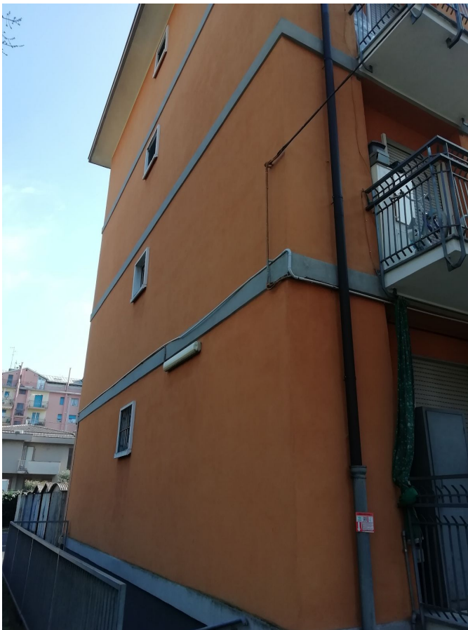
Fotografia 6 - Fronte nord scala "B" - lato interno al cortile.