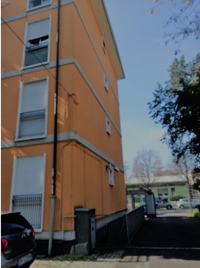
Fotografia 3 - Fronte nord scala "A", fronte interno al cortile.