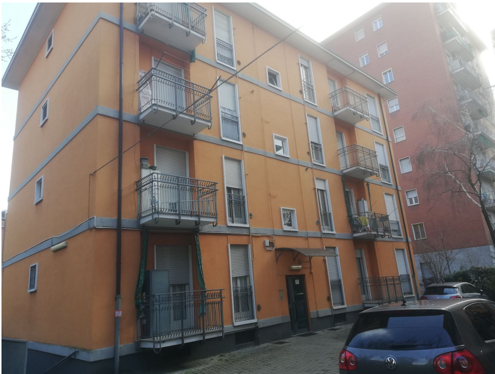
Fotografia 4 - Ingresso scala "B", fronte interno al cortile.