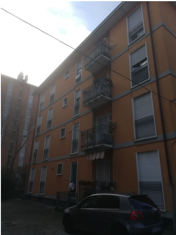
Fotografia 2 - Fronte est scala "A", fronte interno al cortile.