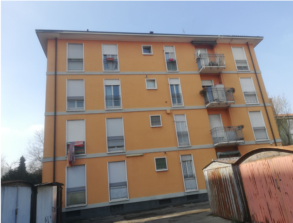
Fotografia 5 - Fronte est scala "B" - fronte interno al cortile.