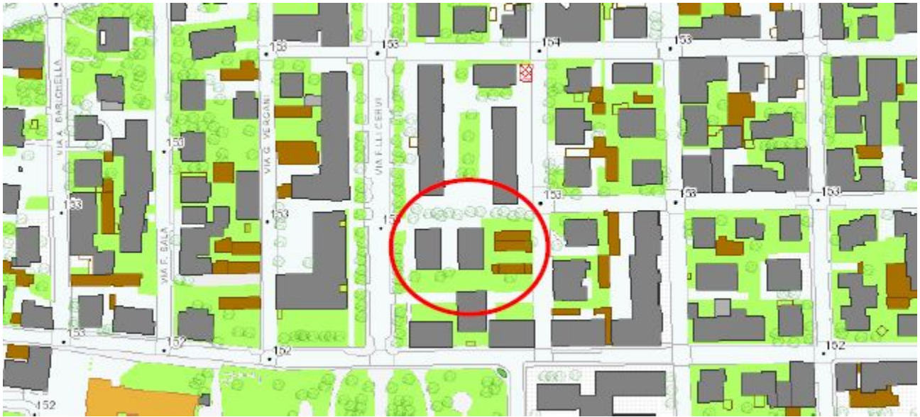
Figura 2 - Database Topografico Regionale