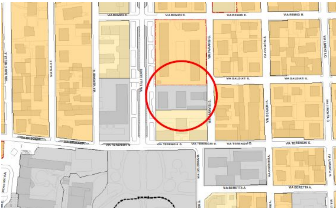
Figura 4 - Estratto Piano del Governo del Territorio - Piano delle Regole