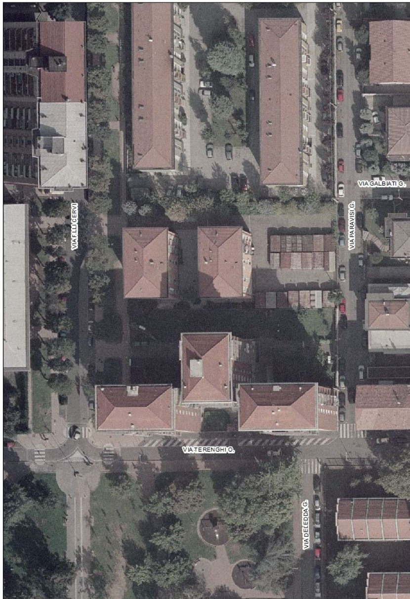
Figura 1 - Vista aerea con individuazione dell'area di intervento

L'area oggetto di intervento è collocata nella zona sud del Comune di Cinisello Balsamo.