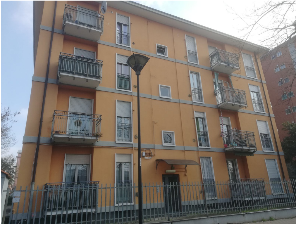
Fotografia 1 - Ingresso scala "A" da via F.lli Cervi.