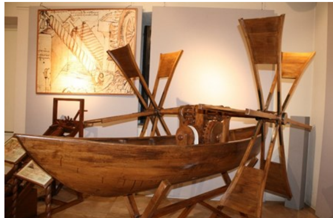
BARCA A PALE