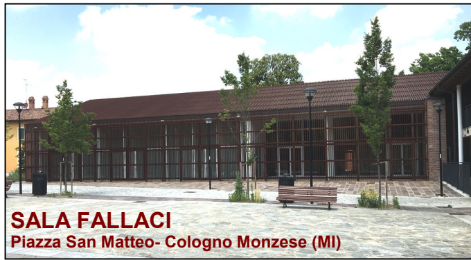
SALA FALLACI Piazza San Matteo- Cologno Monzese (MI)