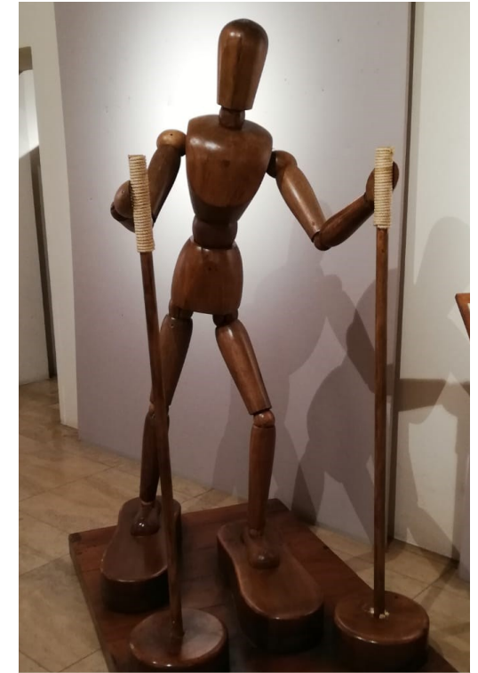
GALLEGGIANTI PER CAMMINARE SULL'ACQUA