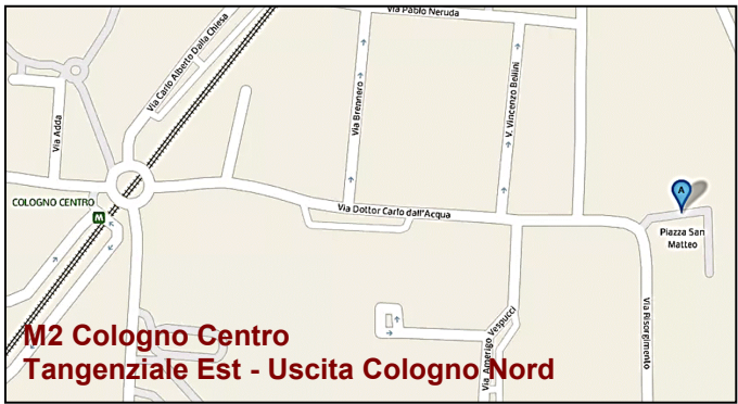
M2 Cologno Centro Tangenziale Est - Uscita Cologno Nord